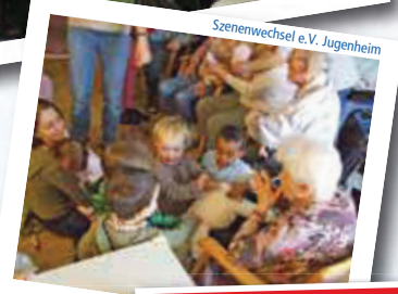
Senenwechsel e.V. Jugendheim