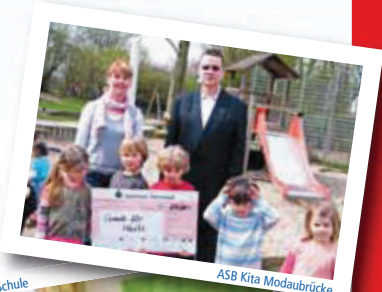
ASB Kita Modaubrücke

In den nächsten drei Ausgaben des fratz möchten wir jeweils vier Projekte kurz mit Bild und Text vorstellen, denn sie haben es wirklich verdient, dass man über sie berichtet und spricht! Auch als Anregung für andere Kindergruppen möchten wir die Berichte sehen. Oft kann schon eine kleine Idee eine große Wirkung haben – man muss sie nur umsetzen!