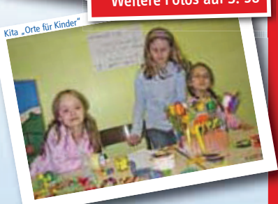
Kita „Orte für Kinder“